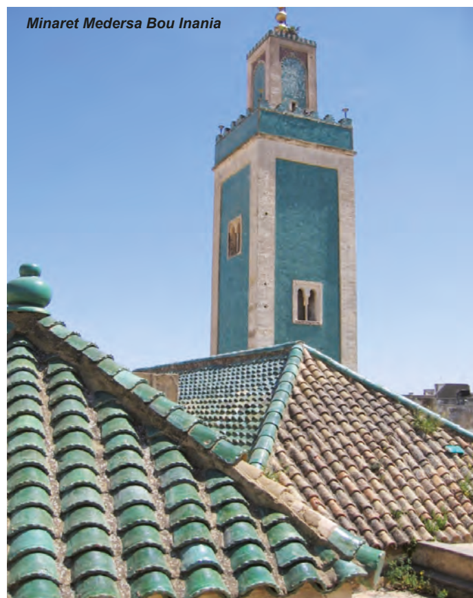
Minaret Medersa Bou Inania

L'exploration des environs de Meknès se termine par la visite du domaine de la Zouira, extrêmement bien tenu où l'on produit de l'huile d'olive, des vins,