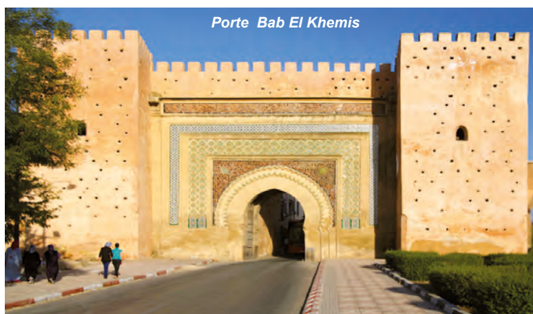
Porte Bab El Khemis

La visite du Maroc et des villes impériales est toujours un plaisir. L'infrastructure routière est impressionnante, le réseau ferroviaire est très développé avec le dernier joyau, le TGV, reliant Casa à Tanger. ■